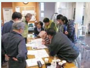
●福祉マップの作成 東柏ヶ谷4丁目地区社協