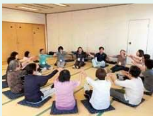
●健康ストレッチサークル 社家・今里・杉久保サンパルク 650・門沢橋・上郷地区