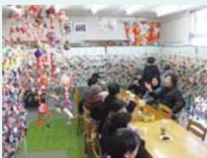
●ハッピーサロン銀の椅子 東柏ヶ谷2丁目地区