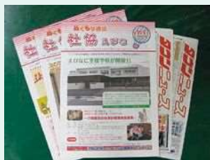
●社協広報紙めくもり通信 及び地域情報紙を活用